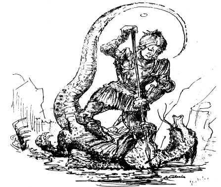
KIRCHE VON WERNSTEIN

Unsere Pflanzen und Bäume pflegen wir; in unserer Wohnung und Umgebung machen wir Ordnung; die Wege, Wiesen und Felder halten wir sauber – warum nicht auch die Beziehung zu den Mitmenschen? Für jede große und kleine Gabe bedanken wir uns herzlich: Warum nicht auch bei dem, der uns die schöne Gegend gemacht und die guten Mitmenschen geschenkt hat?