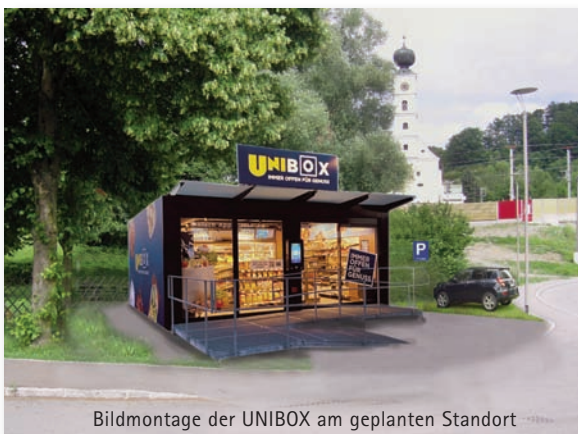
Bildmontage der UNIBOX am geplanten Standort

und Fahrräder von Kunden sind vorgesehen. Mittels Registrierung oder EC-Karte zugänglich,